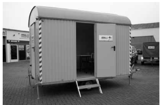
Een bouwkeet voor de werknemers die daar hun broodje eten.