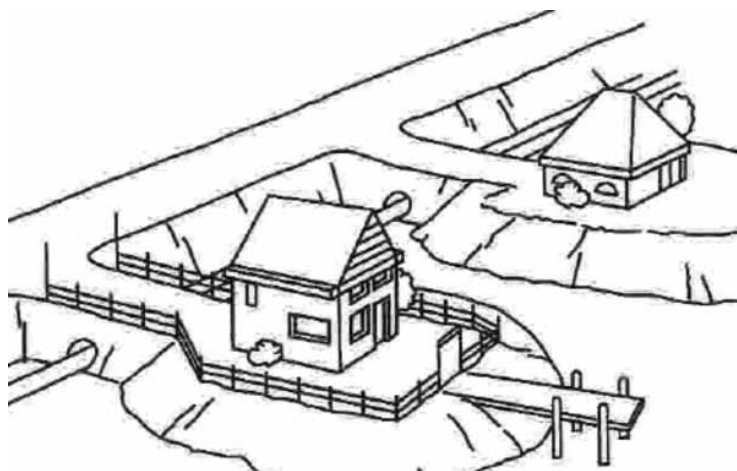
Wonen in de toekomst.

Vroeger gingen mensen wonen op het water omdat ze niet genoeg geld hadden om een gewoon huis te kopen. Maar dat is nu verleden tijd. Mensen willen op het water wonen, omdat ze dat leuk vinden. De rust, het uitzicht, het is allemaal net even anders dan in een gewoon huis. In Nederland is slechts een beperkt aantal officiële ligplaatsen voor woonboten beschikbaar; ongeveer 10.000. Het aantal officiële ligplaatsen wordt in principe niet uitgebreid. De vraag naar ligplaatsen is daarom groot.