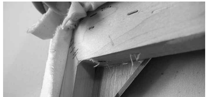
Raamwerk achter het doek