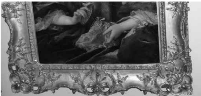
Versierde en opengewerkte schilderijlijst